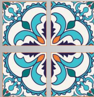
Composición individual con rotación

Para la realización de este paso a paso, utilizaremos imágenes o dibujos de azulejos que encontramos en internet en catálogos de material de construcción o paginas de diseño. Yo en este caso, me he realizado mi diseño mediante ordenador con un programa informático, realizando un diseño, dándole escala, y rotándolo para formar una composición adecuada a la escena que quería componer. Multiplico mi composición hasta rellenar un folio tamaño DIN-A4, y realizando todas las copias necesarias hasta llenar la pared de la escena.